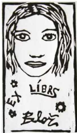
Blaz Baliga , 9.b