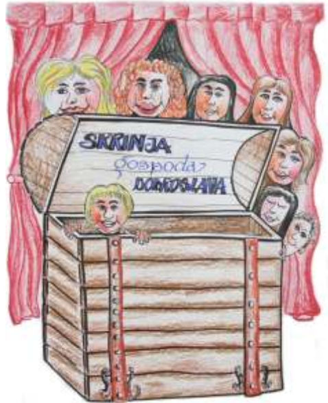
Avtor slike: Franc Poredoš

Pesem je nastala ob premieri gledališke igre Skrinja gospoda Dobroslava, ki jo je pripravila šolska gledališka skupina pod mentorstvom u itelja Marka Jerebi a.