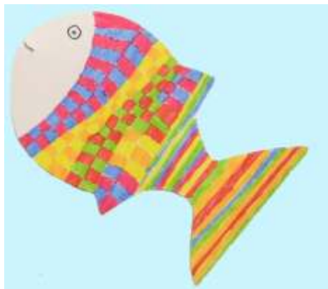
Tadeja Žižek, 4.c