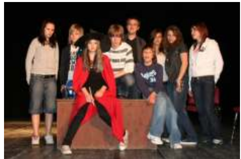
Igralci in mentor na vaji