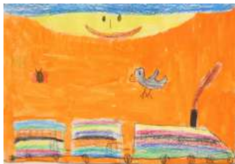
Maja Žalig, 1.b