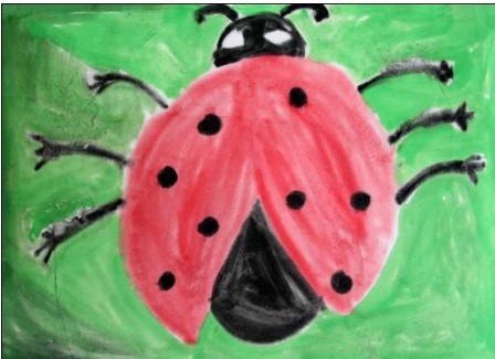
Gaja Zadavec, 3.c