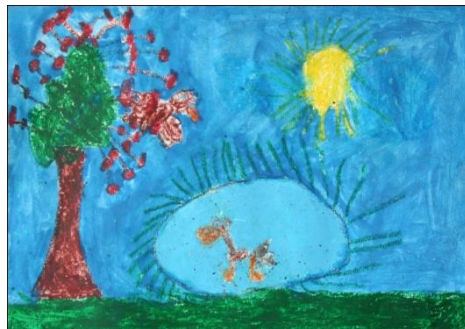
Taya Cmager, 1.b