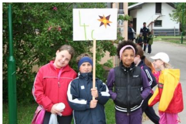
Pohod vseh generacij