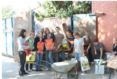
Zbiranje starega papirja