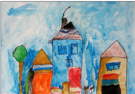
Aljaž Horvat, 1.c