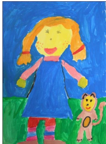
Iva Filip, 2.a