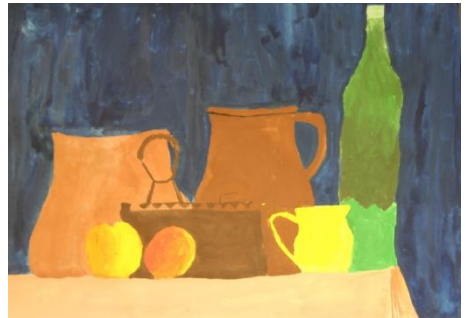
Vanja Koroša, 8.c