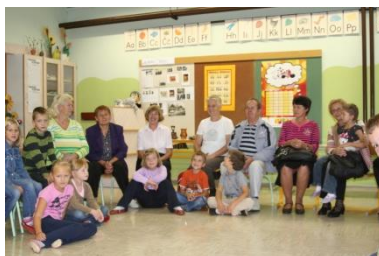
Dedki in babice na obisku v 2. razredu