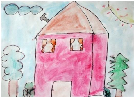
Klara Smej, 1.b

Ogledali smo si grajski ribnik Pri grajskem ribniku smo videli veliko zelenih vodnih družic. Ob vodi pa ravnica. Bila je lepa, ker smo na tih našli še muarjce. IVA FILIP 2.a