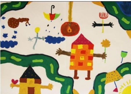
Nastja Erjavec, 6.a