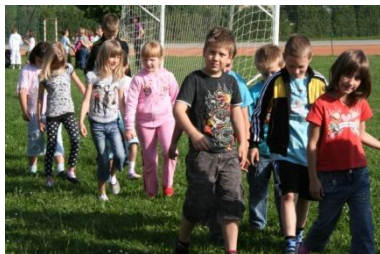
Veselimo se počitnic.