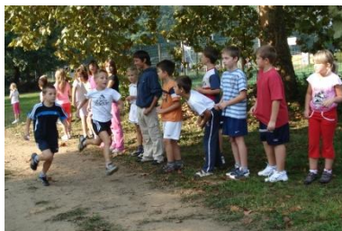
Športni dan za razredno stopnjo