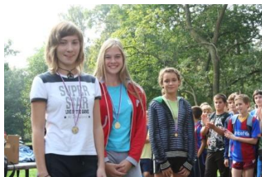
Športni dan za predmetno stopnjo