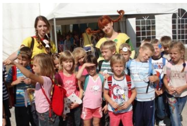
Na Pikinem festivalu v Velenju