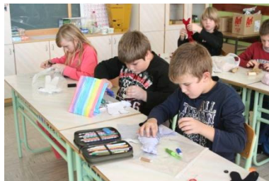
Zadovoljni v šoli