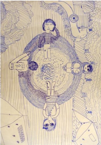
Mojca Žižek, 7.a