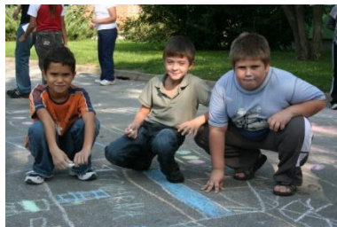
Risanje na asfalt