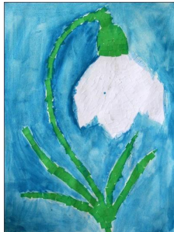
OPB - 4. skupina