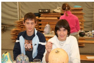
Praznik buč v Lipovcih