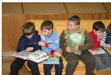
Učenci podružnične šole Melinci v šolski knjižnici