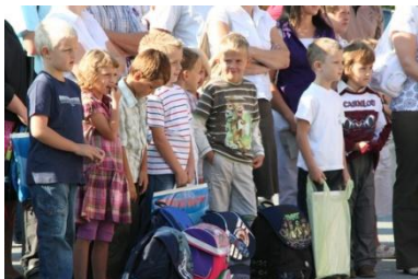
Prvi šolski dan za prvošolce